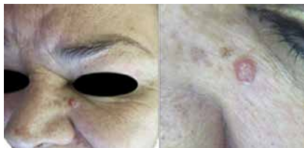
Figura 1. Neoformación en cara, acercamiento.

Mujer de 70 años de edad, sin antecedentes de importancia. Acude a valoración por dermatosis localizada en la cabeza, que afecta la unión del canto interno con la mejilla izquierda, constituida por una neoformación exofítica, cupuliforme, bien delimitada, de 5 × 5 mm aproximadamente, de coloración eritematosa y con un tapón central de queratina (figura 1). Tiene dos meses de evolución con crecimiento progresivo y sin síntomas asociados. Se toma biopsia para estudio histopatológico.