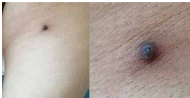
Figura 1. Dermatitis localizada en el muslo izquierdo, con neoformación exofítica, cupuliforme, queratósica, de color café con centro gris.

Se realizó la extirpación quirúrgica con el diagnóstico presuntivo de queratosis seborreica irritada. Las características histológicas se muestran en la figura 2a-c.