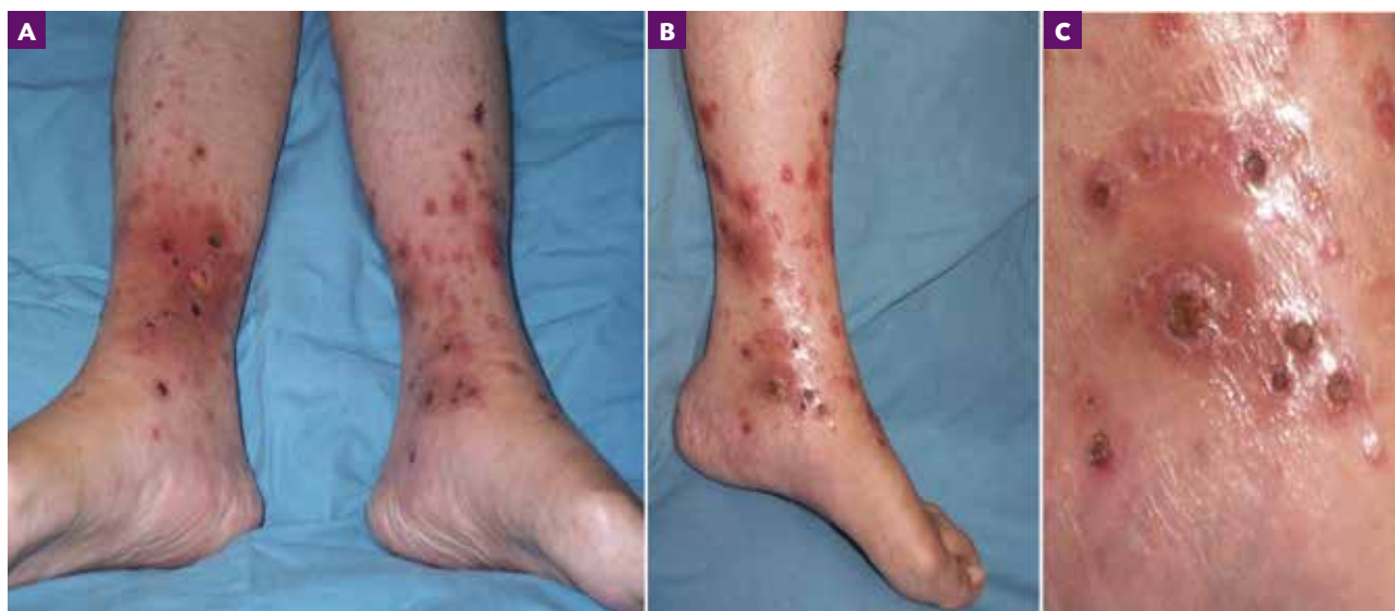
Figura 1. A y B) Dermatitis diseminada en piernas. Numerosas pápulas eritematosas y pápulo-vesículas. C) Úlceras en sacabocado.