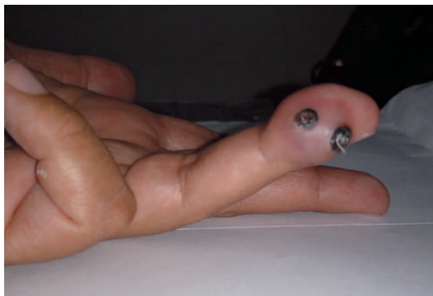
Figura 1. Neoformación de 1 cm, de consistencia dura y dolorosa a la presión, con dos áreas oscuras de aspecto vascular.

Se le realizó extirpación completa de la lesión y se envió a estudio histológico con el diagnóstico de probable hemangioma.