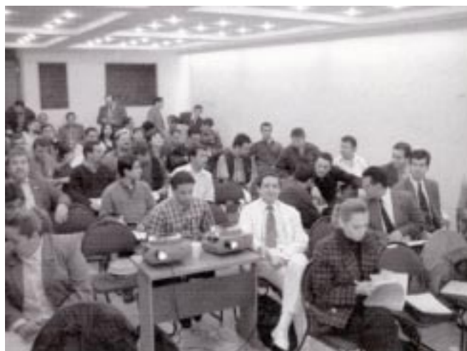
Figura 2. Vista panorámica de los alumnos y del auditorio "Dr. Mario González Ulloa" de la AMCPER.

Existe diferencia estadísticamente significativa para afirmar que el promedio de la evaluación final es mayor que el promedio de la evaluación inicial de los