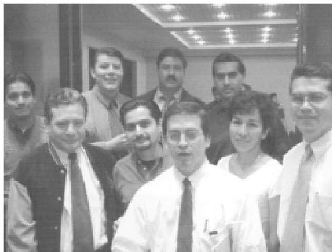
Figura 3. El curso propicia las relaciones interpersonales e intergrupales, debido a que se desarrolla en un ambiente de cordialidad, camaradería y cooperación.

participantes del 10° Curso Nacional de Fundamentos Teóricos y Actualización en Cirugía Plástica, Estética y Reconstructiva, ( p < 0.001 ) por lo que existe aprendizaje significativo.