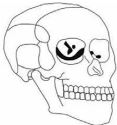
Figura 2. Modelo en el que se aprecia el aumento de la cavidad orbitaria después de realizar la osteotomía.