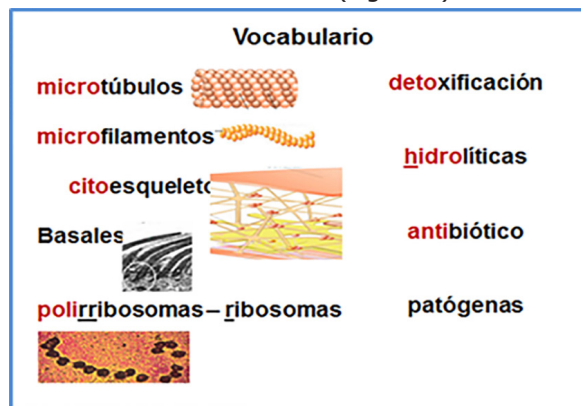
Figura 2. Diapositiva diseñada para el trabajo del vocabulario en la conferencia.

El desconocimiento del significado de las palabras constituye uno de los principales problemas de comprensión de los estudiantes, identificado en el diagnóstico inicial de la asignatura Biología Humana. Precisamente uno de los aspectos en que más puede contribuir esta asignatura es en el conocimiento del significado de las palabras, debido a que trabaja con muchos términos que los estudiantes necesitarán en la carrera de medicina y que todavía no tienen incorporado en su limitado vocabulario al inicio del segundo semestre del curso preparatorio. La conferencia es un tipo de clase muy útil para este fin y el uso de diferentes medios donde puedan leer estas nuevas palabras también. Las presentaciones en diapositivas son útiles para este fin puesto que las palabras con mayor dificultad se pueden destacar con otro color y al momento de su presentación el profesor analiza con los estudiantes su significado. También se pueden utilizar imágenes de objetos que correspondan con las palabras desconocidas, y a partir de la imagen revelar su significado, a este proceso se le denomina decodificación de la información (Figura 2).