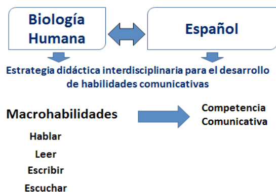
Figura 1. Relación de las asignaturas Biología Humana y español en el desarrollo de habilidades comunicativas.

La asignatura Biología Humana brinda excelentes posibilidades para desarrollar habilidades comunicativas desde su contenido (2), las diferentes Formas de Organización de la Enseñanza y los medios de enseñanza (Figura 1).