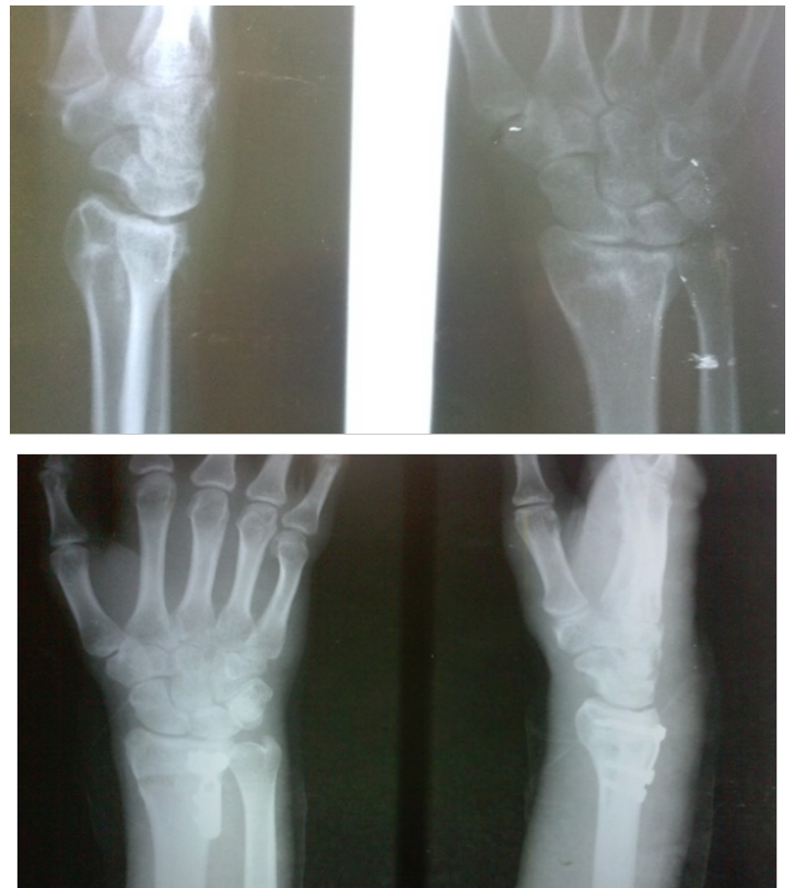
Figura 2. Imágenes radiográficas antes y después de la cirugía.