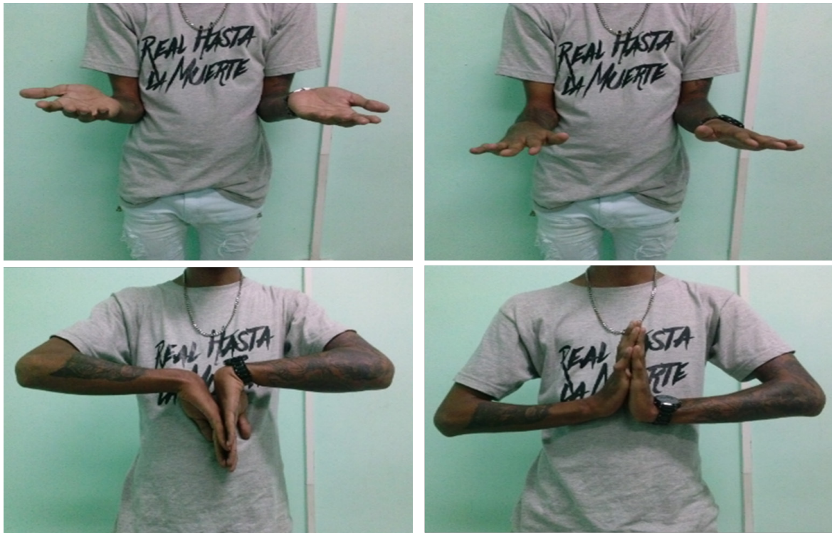
Figura 3. Resultado clínico a los 6 meses.