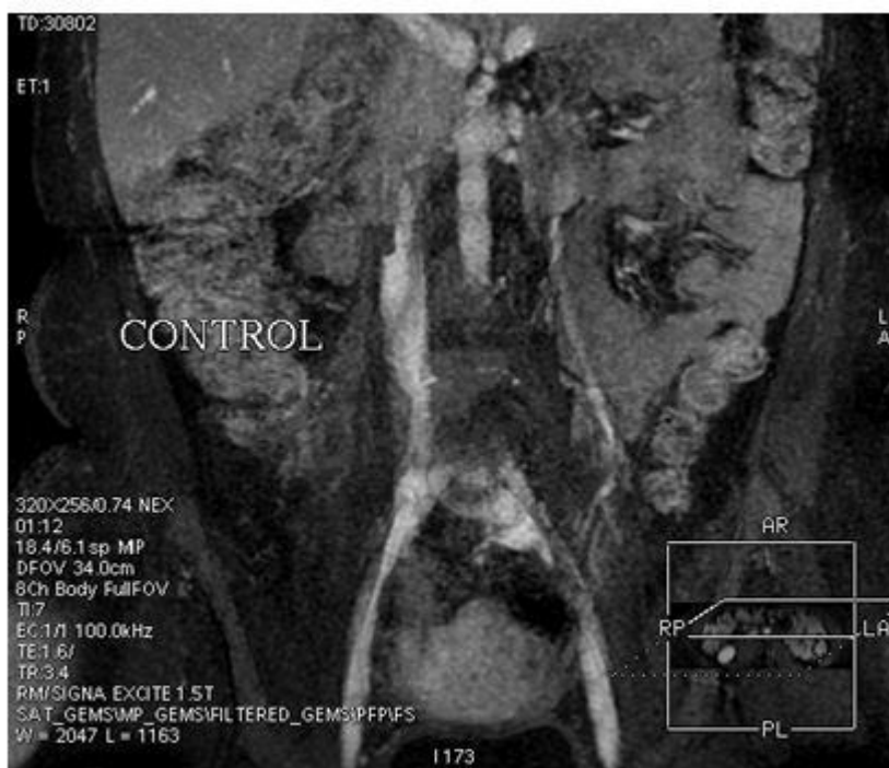
Figura 4. Fleborresonancia de control. Resolución parcial de la trombosis a las dos semanas del estudio inicial.

La paciente ha permanecido durante 6 meses con acenocumarol y, en estos momentos se encuentra asintomática y pendiente de un estudio de hipercoagulabilidad por parte de hematología.