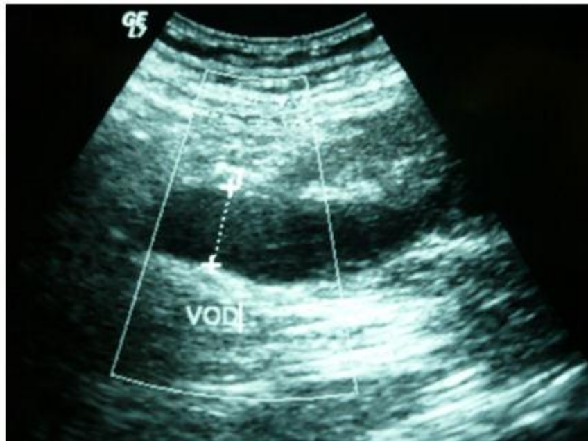
Figura 1. Ecografía abdominal. Trombosis de la vena ovárica derecha.

ovárica y de sector ilio-cava, con un trombo distal en cúpula que se situaba cerca de las venas renales, pero sin afectarlas (figura 2).