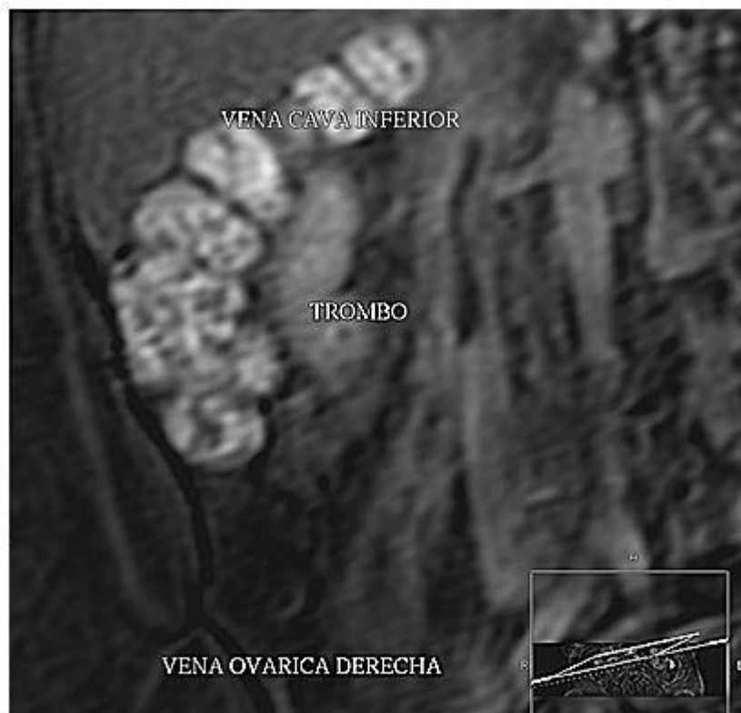
Figura 2. Fleborresonancia magnética. Trombosis desde la vena ovárica hasta la cava inferior infrarrenal.