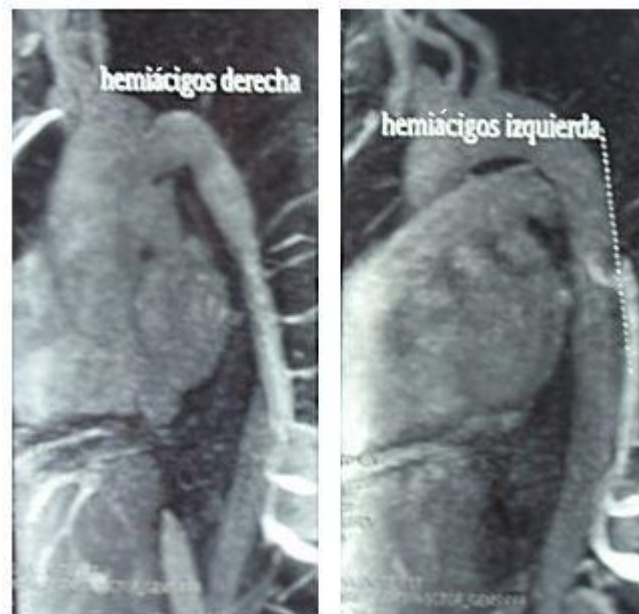
Figura 6. Desarrollo del sistema ácigos.

De esta manera, se llegó al diagnóstico de trombosis de vena cava inferior infrarrenal y agenesia del sector retrohepático. Se inició tratamiento anticoagulante (de inicio, con heparina de bajo peso molecular, para proseguir con acenocumarol), medidas higiénico-posturales y antibioterapia frente a la celulitis (ciprofloxacino 500 mg/12 h durante 2 semanas).