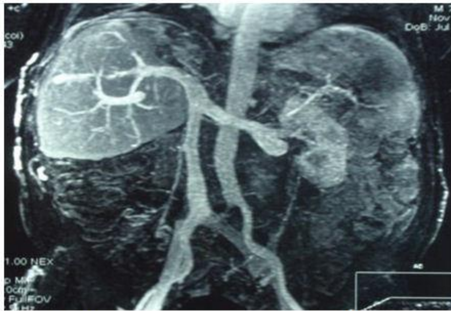
Figura 5. Fleborresonancia con permeabilidad del sistema porta y drenaje de las venas renales al sistema ácigos.

sistema ácigos (figura 5). Tanto el sistema ácigos-hemiácigos, como las venas paraespinales y epigástricas, presentaban un desarrollo vicariante (figura 6).