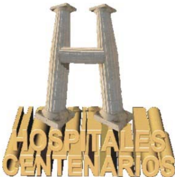
Fig. 6. Logotipo de los Encuentros entre los Servicios de Cirugía de Hospitales Centenarios.