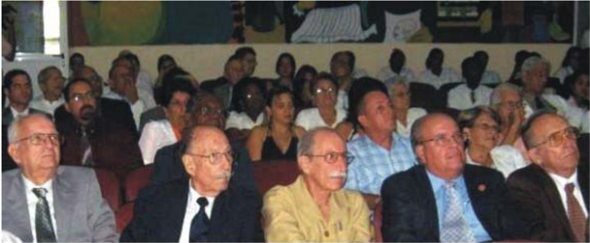
Fig. 3. Algunos homenajeados en ese I Encuentro.