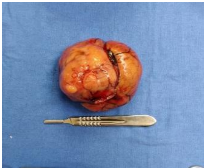
Fig. 2- Pieza quirúrgica. GIST gástrico.

y bien definida, Doppler positiva, sin evidencia de crecimiento ganglionar a distancia. Se realizó biopsia por aspiración con aguja fina (BAAF). El reporte de patología fue tumor del estroma gastrointestinal (GIST), tipo células fusiformes, expresión de DOG-2, CD117 y CD 34, índice de proliferación < 1 %. Se programó para laparotomía, porque por laparoscopia se pensó en un elevado riesgo de fragmentación del tumor (Fig. 2).