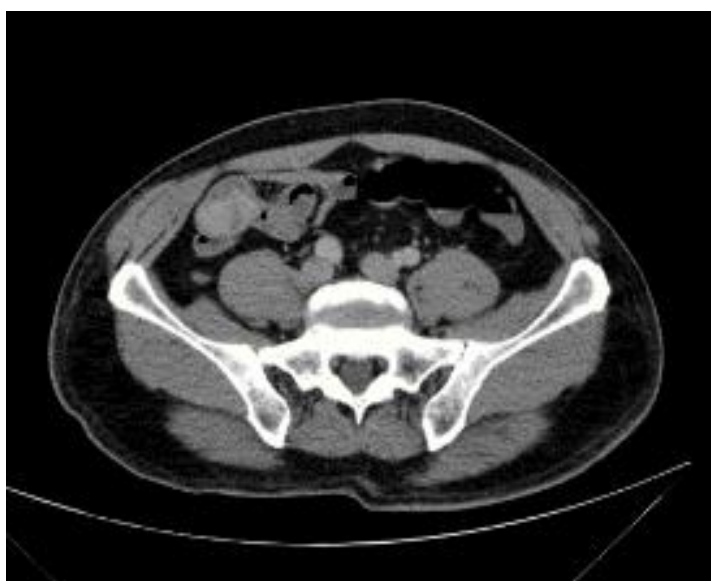
Fig. 3- TAC de abdomen axial con presencia de tumor en intestino delgado, inicialmente se pensó en un divertículo de Meckel, sin embargo, se encontró un tumor de intestino delgado.

Paciente masculino de 56 años de edad sin antecedentes de enfermedades, alergias o cirugías, únicamente convivencia con animales de granja, acudió a urgencias del Hospital de Especialidades del Centro Médico Nacional La Raza por sangrado de tubo digestivo bajo. Inició su padecimiento con dolor abdominal difuso con predominio en epigastrio, intensidad moderada, acompañado de náuseas y vómitos de características gastrointestinales en 8 ocasiones, agregándose posteriormente evacuaciones hematoquecicas con rectorragia. Se realizó endoscopia que reportó esofagitis grado A de los Ángeles y pangastritis erosiva moderada. Debido a que no se encontró la causa del sangrado del tubo digestivo se hizo colonoscopia, sin embargo, en esta no se identificaron lesiones en recto o colon, pero informó que en los últimos 10 cm del íleon terminal había presencia de sangrado sin identificar la causa; por lo que se concluyó con diagnóstico de sangrado de tubo digestivo medio. Se realizó TAC contrastada de abdomen que reportó lesión sacular con márgenes lisos, bien definidos de contenido hiperdenso en fase contrastada con valores de atenuación de 83 UH, dimensiones de 32 x 37 x 30 mm en sus ejes en relación a divertículo de Meckel , (Fig. 3).