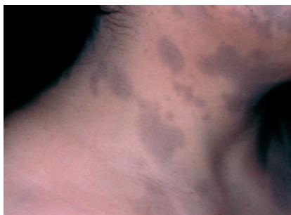
Figura 2. Manchas hiperpigmentadas, color café de aspecto cenizo de límites bien definidos, forma oval que confluyen entre sí.

oval a policíclica irregular, que es la más frecuente. Aparecen sucesivamente sin síntomas precedentes, se extienden lentamente hacia la periferia, llegando a ser confluentes y pudiendo afectar a todo el cuerpo. No se han reportado complicaciones significativas.