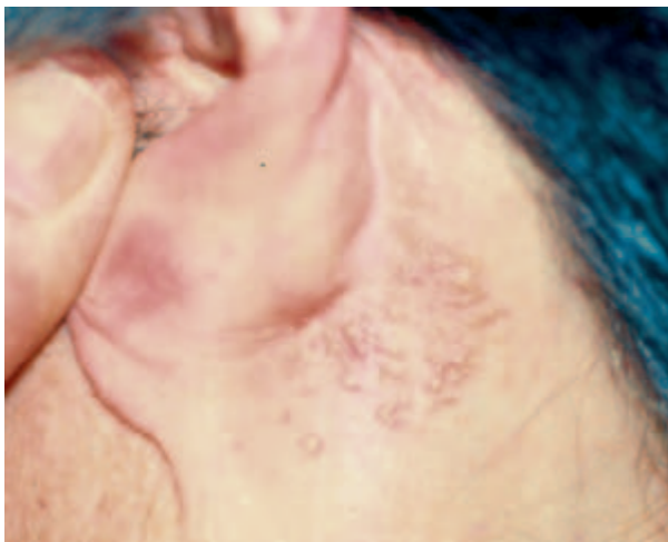
Figura 2. Quistes miliars sobre una placa amarillenta en región retroauricular izquierda.