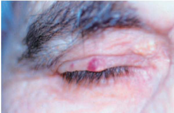
Figura 1. Placa de quistes miliars en párpado derecho.