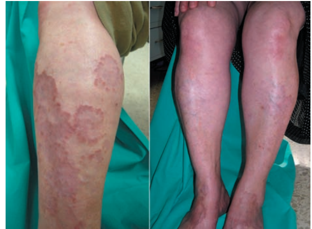
Figura 2. Foco de necrobiosis del colágeno rodeado por histiocitos en “empalizada”.

El GA generalizado, reviste especial interés, tanto por su presentación inusual[1], sus posibles asociaciones patológicas y por las dificultades terapéuticas que plantea, pero sobretudo