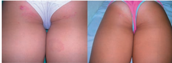
Figura 1. Caso1: Antes y a las 4 semanas de tratamiento con vitamina E tópica.

subpapilar, la presencia de áreas de colágeno necrobiótico rodeadas por histiocitos en “empalizada”. La paciente había realizado tratamiento con corticoides tópicos sin ninguna respuesta. Ante la preocupación de la madre por la repercusión cosmética y, tras revisar las distintas opciones terapéuticas, decidimos por su inocuidad, instaurar tratamiento con vitamina E tópica, 2 veces al día, formulada en aceite de germen de trigo al 0.5%. Se observó una evolución favorable, con resolución total de las lesiones a las 4 semanas de tratamiento (Figura 1) que se mantuvo en los seguimientos posteriores realizados durante 1 año.