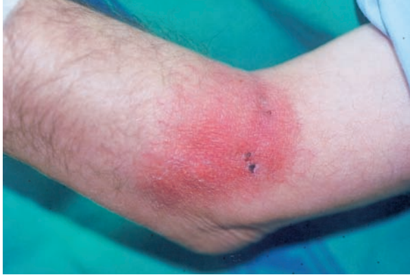
Figura 1. Placa eritematoviolácea en antebrazo.