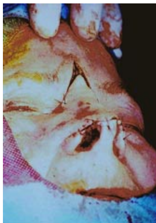
Figura 3. Avance distal de 1,5 cm y sutura directa del defecto.