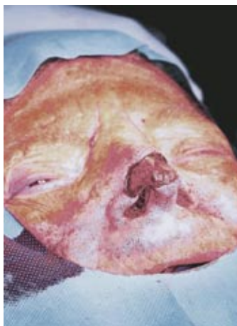
Figura 2. Extirpación del tumor e incisión sobre el colgajo.