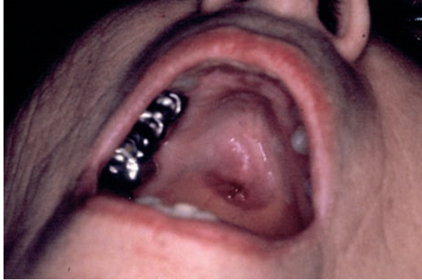
Figura 1. Tumoración en paladar duro, ulcerada en uno de sus extremos.