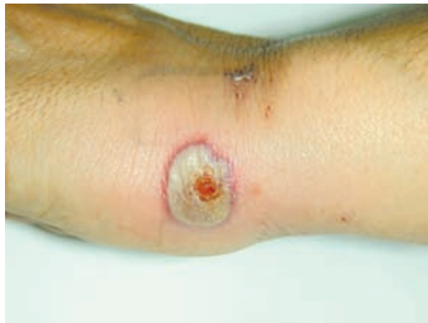
Figura 2. Detalle de una de las lesiones.

La DNDM aparece con mayor frecuencia en mujeres de mediana edad. Se presenta con placas eritematosas que evolucionan a pústulas de base eritematosa, y estas a placas ulceradas dolorosas. Las lesiones se localizan en el dorso de las manos, habitualmente en la zona radial. No suelen acompañarse de clínica sistémica, aunque algunos pacientes presentan fiebre y malestar general. En un principio son diagnosticados como infecciones cutáneas, pero los cultivos son negativos y el tratamiento antibiótico no es eficaz. En la