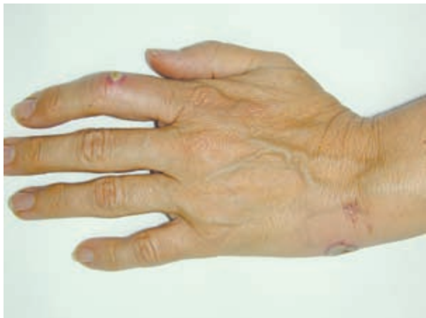
Figura 1. Placas eritemato-edematosas, pustulosas en el dorso de la mano izquierda.

base eritemato-edematosa y superficie ulcerada y otra de 0,5 cm en el dorso del segundo dedo de la misma mano (Figuras 1 y 2). No presenta adenopatías loco-regionales.