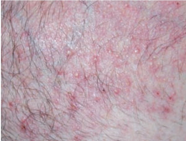
Figura 2. Pústulas de localización folicular con un halo inflamatorio periférico a nivel del tronco.

que se expresa en distintas neoplasias epiteliales y este hecho se ha relacionado con un estadio tumoral avanzado, resistencia a tratamientos y, en general, peor pronóstico[2, 3]. En la piel humana normal, EGF-R está presente en los queratinocitos basales, en células de las glándulas sebáceas y ecrinas y en la vaina radicular externa del folículo piloso[4] y su activación produce, entre otros efectos, una reducción de la capacidad de diferenciación terminal de los queratinocitos basales promoviendo la diferenciación de los queratinocitos suprabasales y una estimulación de la transición de anagen a catagen a nivel del folículo piloso[5].