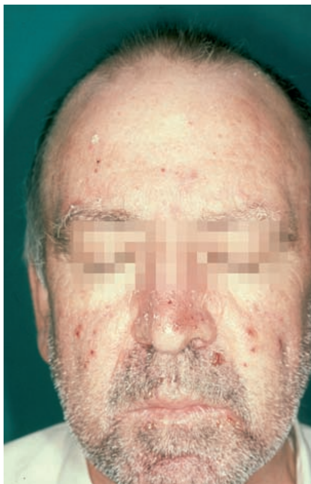
Figura 1. Pústulas y pápulo-pústulas foliculares así como escamocostras localizadas en la región facial.

Varón de 54 años de edad, diagnosticado de un carcinoma pulmonar no microcítico en estadio IV. Tras el fracaso de la terapia con docetaxel y antineoplásicos derivados del platino, se inició tratamiento con gefitinib a dosis de 250 mg/día por vía oral. Una semana después comenzó con una erupción de lesiones papulosas y pustulosas foliculares localizadas en cara y cuello. Se realizó una biopsia y el estudio histopatológico demostró un infiltrado inflamatorio linfohistiocitario perifolicular con abundantes polimorfonucleares neutrófilos. El paciente fue tratado inicialmente con mupirocina al 2% en pomada y cloxacilina 500 mg vía oral cada 8 horas durante 10 días con respuesta parcial, y posteriormente con minociclina 100 mg al día con resolución de las lesiones sin ser necesaria la suspensión del tratamiento antineoplásico.