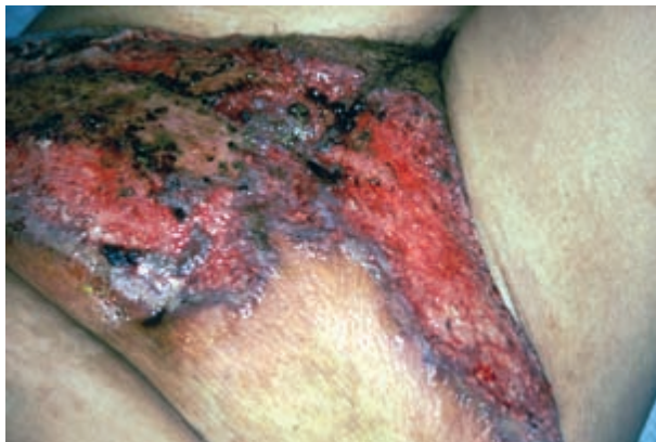
Figura 1. Ulceración extensa, de bordes violáceos, comprometiendo hipogastrio y fosa iliaca izquierda.

tamaño hasta comprometer todo el hipogastrio y la fosa iliaca izquierda (Figura 1). Fue tratada en su comunidad con amoxicilina-sulbactam sin mejoría. Posteriormente aparecieron lesiones de iguales características aunque de menor tamaño en la rodilla (Figura 2), pie izquierdo y brazo derecho. En el transcurso de su internación presentó nuevas lesiones en la lengua, pabellón auricular y hombros.