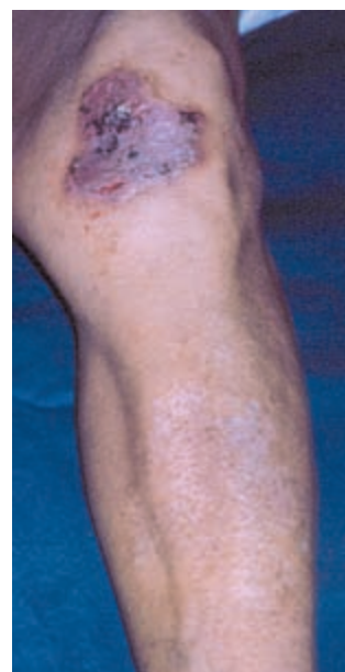
Figura 2. Placa ulcerada y lesiones residuales en la rodilla izquierda.

Luego de algunos meses de internación, con el progresivo deterioro de su estado general, la paciente falleció por complicaciones infecciosas.