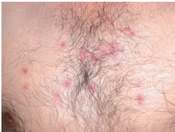
Figura 2. Pápulas y pústulas foliculares localizadas en la región centrotorácica.

Un varón de 42 años de edad, con antecedentes personales de adicción a drogas por vía parenteral (ADVP) (heroína marrón disuelta con limón y cocaína, de consumo no diario), hepatitis por VHC tratada con interferon y ribavirina en Abril de 2005, HIV negativo y apendicectomía, consultó por la presencia de lesiones cutáneas dolorosas localizadas en