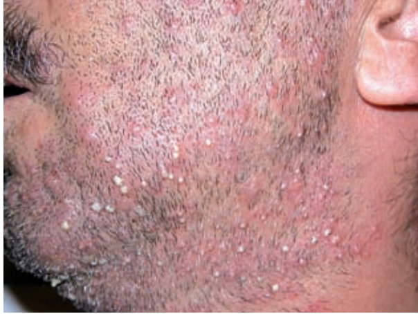
Figura 1. Pústulas foliculares localizadas en la región de la barba.

al.[3]. En la década de los noventa la incidencia de la candidiasis sistémica disminuyó notablemente, siendo en la actualidad una entidad excepcional.