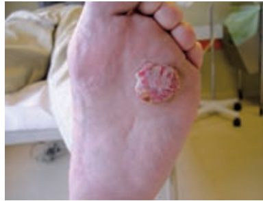
Figura 1. Tumor excrecente, de 3 x 2,5 cm de diámetro, de superficie verrugosa y eritematosa localizado en la planta del pie izquierdo.

Se realizó una biopsia cuyo estudio histopatológico mostró una tumoración