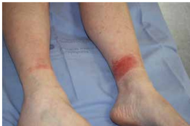
Figura 2. Caso 3. Lesiones de 24 horas de evolución.