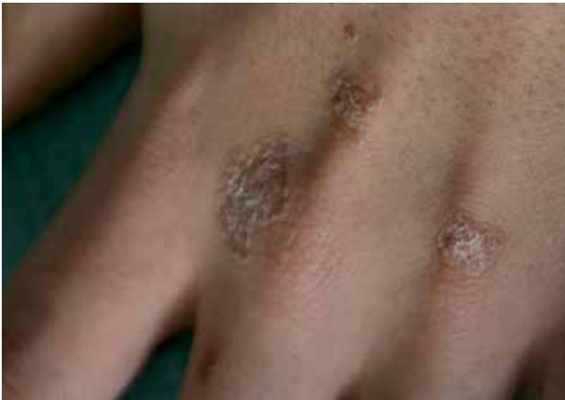
Figura 2. Lesiones circinadas con borde sobreelevado y centro atrófico.