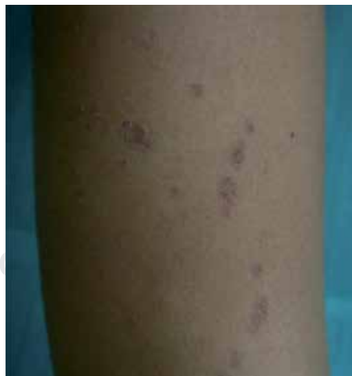
Figura 1. Lesiones con disposición lineal en antebrazo.

Se realizó entonces una biopsia de una de las lesiones del antebrazo, cuya descripción histopatológica fue de foco de depresión epidérmica, con desaparición de la capa granulosa y columna de paraqueratosis focal, discreta vacuolización de la capa basal y presencia de cuerpos de Civatte y melanófagos en dermis superficial (Figura 3).