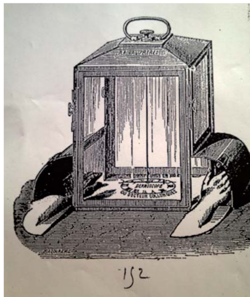
Figura 1. Dermoscopia inventado por el Dr. Collongues en 1887.