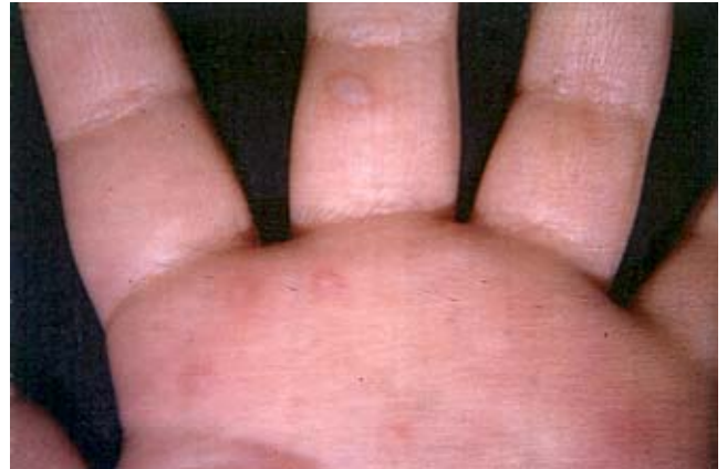
Figura 2. Vesículas en palmas y caras palmares de dedos.