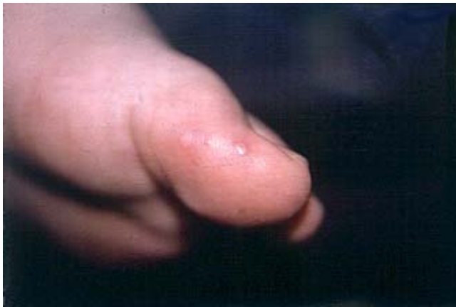
Figura 3. Lesiones iniciales en caras lateral de primeros ortijos y plantas.

matitis dolorosa. 8 Es una enfermedad muy contagiosa, la transmisión es horizontal de niño a niño y de forma vertical a los adultos. 2 Se han aislado y asociado como causantes de esta enfermedad al virus Coxsackie A16 y al enterovirus 71. 1-3,6,7 Este último tiene tendencia estacional, sus periodos agudos de enfermedad ocurren en climas templados. Las formas más habituales de aislamiento del Coxsackie o del enterovirus son las heces fecales y/o de la faringe. 2