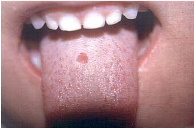
Figura 1. Lesiones iniciales de lengua (úlceras).