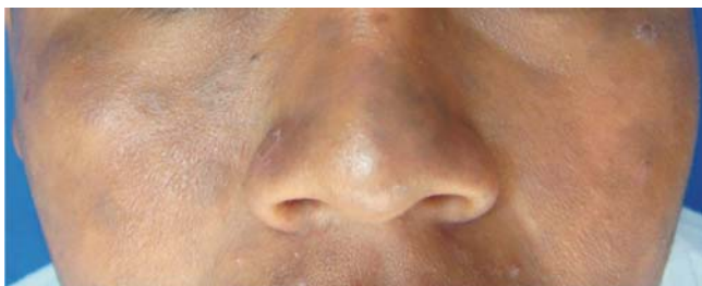
Figura 2. Placas eritematovioláceas e hiperpigmentadas.