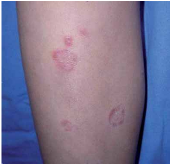
Figura 1. Pápulas escamosas finas que forman placa.

a extremidades inferiores, constituida por pápulas eritematosas brillantes con escama fina, que confluyen para formar placas anulares, bilaterales y asimétricas ( Figura 1 ). Se toma biopsia incisional en la cual se observa ( Figura 2 ). Con estos datos, ¿cuál es su diagnóstico?