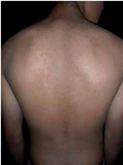
Figura 1. Aspecto de la cara posterior del tórax.

Con los datos antes descritos, ¿cuál es su diagnóstico?