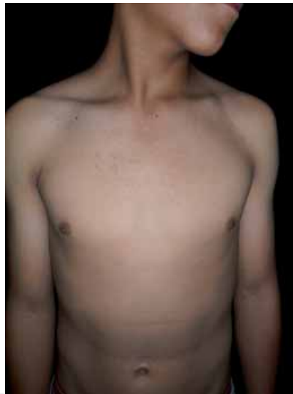
Figura 2. Aspecto de la cara anterior del tórax.