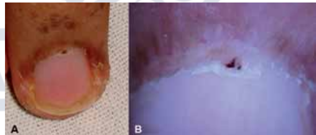
Caso 3. A. Pequeño hematoma del pliegue proximal y engrosamiento de la cutícula en un paciente masculino de 24 años de edad. B. Aspecto dermatoscópico de la lesión.

Dermatóloga, Hospital General, Instituto Guatemalteco de Seguridad Social, Guatemala, CA.