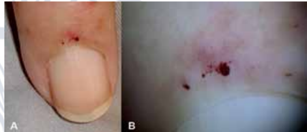
Caso 1. A. Pequeños hematomas del pliegue proximal de 24 horas de aparición en una paciente diabética de 60 años de edad, internada en la unidad de terapia intensiva. B. Aspecto dermatoscópico de la lesión.

Las respuestas están al final de la página.