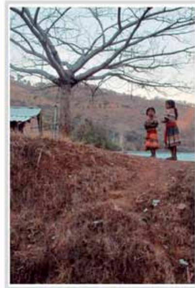
"Palomas que anidan lejano"