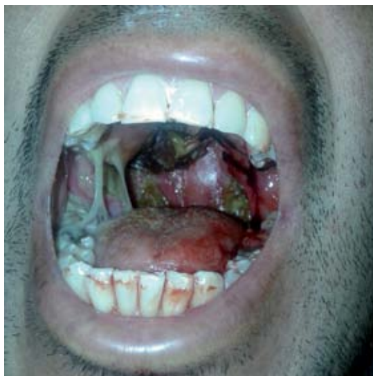
Figura 1. Cavidad oral con placas blanquecinas adheridas que afectan el paladar duro y blando.

Se realizaron estudios micológicos: al examen directo con KOH (10%) se observaron filamentos con arthroconidios redondeados, sugerentes de infección por Geotrichum y Trichosporon . Al cultivo se obtuvo colonia blanca de vello