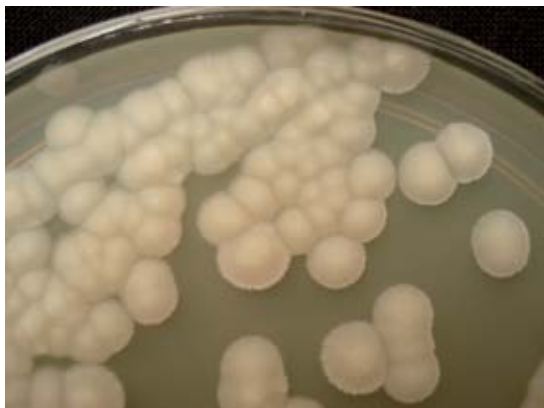
Figura 2. Cultivo de S. capitata en medio de Sabouraud dextrosa agar.