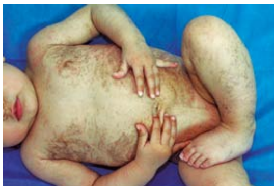
Figura 5. Incontinencia pigmentaria (fase hiperpigmentada) hiperpigmentación predominantemente parda en el tronco y las extremidades inferiores, siguiendo las líneas de Blaschko en una paciente de siete meses de edad.

Por su baja incidencia, la incontinencia pigmentaria es una enfermedad poco sospechada y es probable que se diagnostique erróneamente como otra dermatosis. Los médicos no dermatólogos suelen considerar las pústulas como infecciosas; sin embargo, son muchas las enfermedades no infecciosas que forman parte