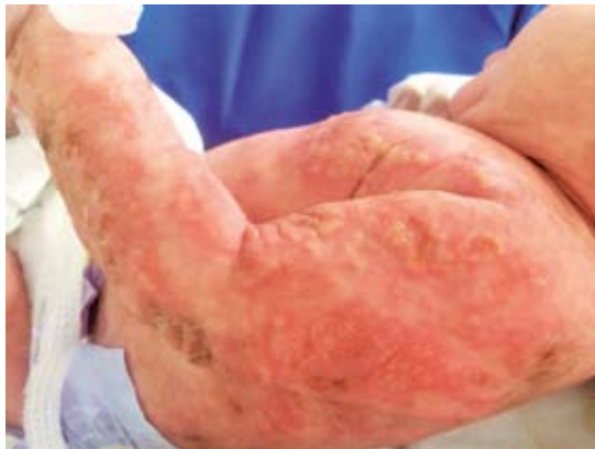
Figura 1. Incontinencia pigmentaria (fase vesicular). Vesículas en el brazo y el tórax anterior de un paciente de 10 días de edad.

Este nuevo diagnóstico llevó a una tamización de las asociaciones oftalmológicas y neurológicas. El examen oftalmológico detectó estrabismo y leucocoria del lado derecho, la resonancia magnética nuclear mostró microftalmia y desprendimiento retiniano del ojo derecho, sin