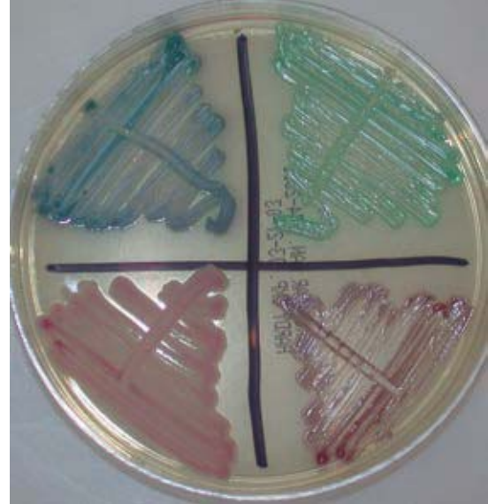
Figura 4. Tipificación de Candida mediante CHROM-agar Candida . Cuadrante superior izquierdo: C. tropicalis . Cuadrante superior derecho: C. albicans . Cuadrante inferior izquierdo: C. krusei . Cuadrante inferior derecho: C. glabrata .

onicomicosis en onicodistrofia del quinto dedo de los pies. En el estudio realizado por Balderama y su grupo en pacientes con distrofia de la uña del quinto dedo se encontró frecuencia de onicomicosis de 21%, con predominio de T. rubrum y la forma clínica más frecuente fue la distrófica total. También se encontraron con frecuencia melanoniquia y paquioniquia. 6