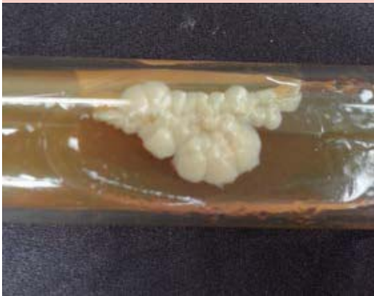
Figura 3. Candida sp.

onicomicosis en onicodistrofia del quinto dedo de los pies. En el estudio realizado por Balderama y su grupo en pacientes con distrofia de la uña del quinto dedo se encontró frecuencia de onicomicosis de 21%, con predominio de T. rubrum y la forma clínica más frecuente fue la distrófica total. También se encontraron con frecuencia melanoniquia y paquioniquia. 6