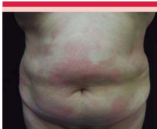
Figura 2. Características clínicas de la micosis fungoide en placas.

sibles desencadenantes. Una de las principales teorías es que la micosis fungoide es secundaria a la estimulación crónica por un antígeno que provoca la expansión clonal de células T que carecen del mecanismo de apoptosis mediado por FAS. Varios virus (HTLV-1: human T-cell leukemia virus type 1 , HTLV-2, VEB, herpes virus 8 y citomegalovirus) y bacterias se han propuesto como el probable factor antigénico que des-