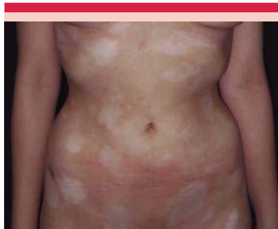
Figura 1. Características clínicas de la micosis fungoide hipopigmentada.

La causa de esta entidad se desconoce; sin embargo, se han propuesto múltiples factores infecciosos, genéticos y ambientales como po-