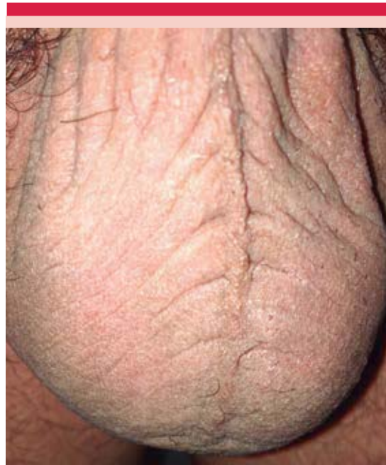
Figura 4. Cicatriz eutrófica residual.

Se programó cirugía para tratar el resto de las lesiones, retirándolas en bloque, mediante técnica de jareta con sutura absorbible en puntos simples, con lo que se logró un adecuado resultado cosmético, sin complicaciones o recidiva (Figura 4).