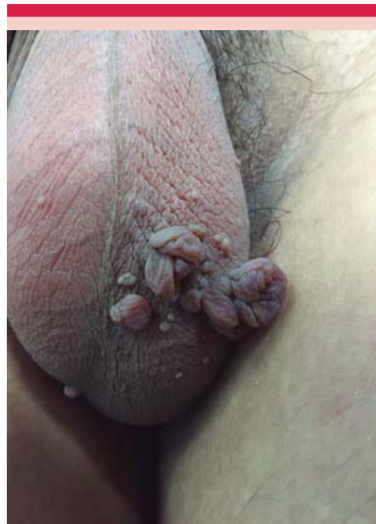
Figura 1. Múltiples neoformaciones exofíticas pediculadas de base ancha en la bolsa escrotal.

Se realizó biopsia por rasurado de una de las lesiones que reportó una neoformación exofítica con epidermis acantósica. En el espesor de la dermis se encontraron numerosos vasos dilatados y congestionados con pared hialinizada, así como engrosamiento de las fibras de colágena que seguían diversos trayectos y células de aspecto fusiforme y epitelioides (Figuras 2 y 3). Con base en los hallazgos histológicos, se realizó el diagnóstico de angiofibroma celular.