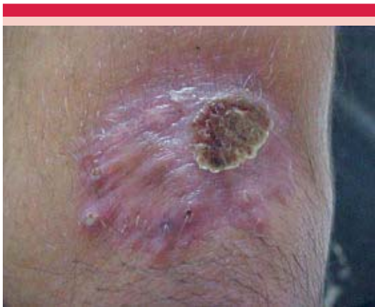
Figura 2. Melanoma verrugoso primario después del tratamiento.

del paciente ha sido satisfactoria sin mostrar limitación funcional de la extremidad y a tres años de seguimiento no ha tenido recidiva local ni metástasis a distancia.