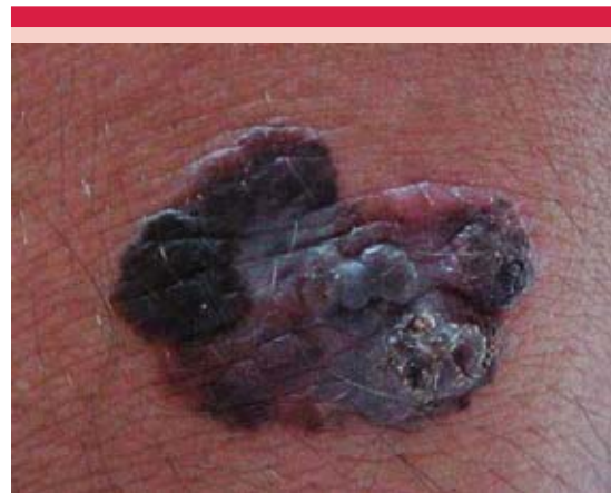
Figura 1. Melanoma verrugoso primario basal.

La exploración física de la cabeza y el cuello fue normal, sin adenomegalias, el tórax y el abdomen sin visceromegalias, en la extremidad superior izquierda, en la cara posterior del brazo a nivel del codo, se observó una neoformación pigmentada de 3x3 cm, asimétrica, con bordes irregulares, de coloración heterogénea negra y marrón y áreas de hipopigmentación (Figura 1). No se palparon adenomegalias en las axilas. Los estudios de laboratorio (biometría hemática, química sanguínea y pruebas de función hepática) estaban en rangos normales. La telerradiografía de tórax y la tomografía de tórax y abdomen se reportaron normales.