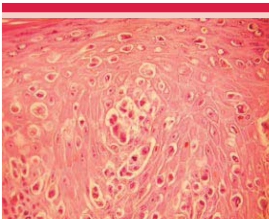
Figura 5. Microfotografía a 40X con la técnica de H&E que exhibe la atipia nuclear, el pigmento intracitoplásmico y en algunas células pueden observarse los núcleos con nucléolo prominente y otros con binucleación y menos de dos o tres mitosis por campo.

verrugosa y con hiperqueratosis de la epidermis no encajan en esta clasificación. 11