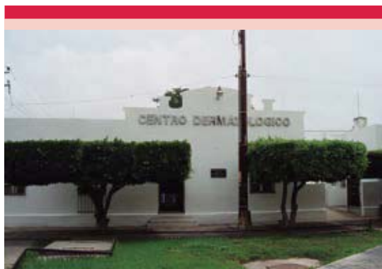
Figura 4. Centro Dermatológico de Yucatán Dr. Fernando Latapí en la actualidad.

En fecha reciente, tras un estudio clínico retrospectivo de 1950 a 2013, efectuado en el Centro