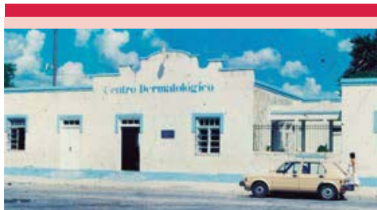
Figura 3. Centro Dermatológico de Yucatán a principios del decenio de 1980.