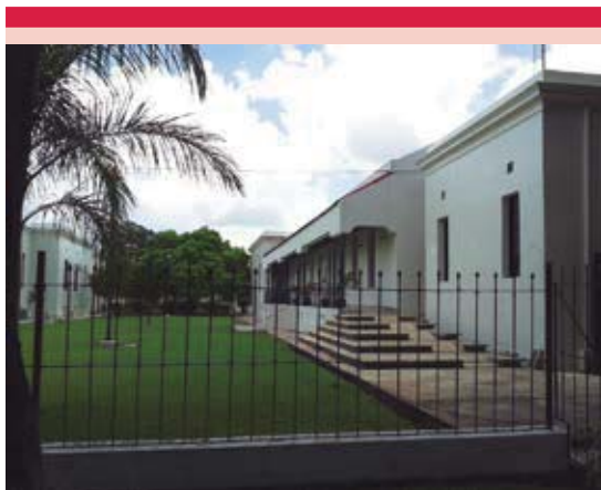
Figura 2. Hospital O'Horán. En la actualidad los pabellones se destinan como oficinas.

de Yucatán (CDY). 15 Este establecimiento inició sus actividades el 2 de febrero de 1949, abarcaba las funciones de dispensario antileproso y pabellón para internar a pacientes con este padecimiento, formando parte física integral y sujetándose administrativamente a la reglamentación que regía al Hospital O'Horán, perteneciente a la Secretaría de Salubridad y Asistencia (actual Secretaría de Salud). Una vez que los enfermos de lepra pudieron ser atendidos de manera ambulatoria y que se suprimió la hospitalización de los pacientes en un pabellón exclusivo, el Centro Dermatológico se convirtió en autónomo del Hospital O'Horán, al mismo tiempo que continuó con la atención de otras enfermedades de la piel a la población abierta. 16 Asimismo, el modelo de un hospital extendido y conformado por pabellones independientes, que se había implementado para el hospital O'Horán, cayó en desuso; las antiguas construcciones se destinaron para albergar oficinas administrativas propias del hospital, archivos y otros servicios no médicos (incluida la sede local de una cadena radiodifusora nacional) y se construyó una torre dentro del mismo terreno para albergar y ofrecer servicios hospitalarios (Figuras 2 y 3).