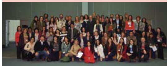
Parte del grupo de asistentes.