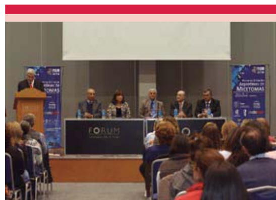
Presidio de la reunión.