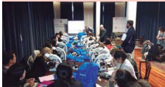
Trabajo práctico precongreso (maestría en Micología médica).

Esta reunión internacional del micetoma es de aquéllas en que, sin grandes pretensiones, uno termina aprendiendo tanto, consolida nuevos grupos de trabajo y plantea nuevos trabajos.