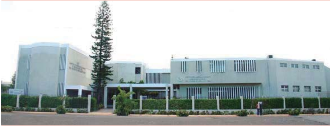
Figura 1. Instituto Dermatológico y Cirugía de Piel Dr. Huberto Bogaert Díaz, en República Dominicana.