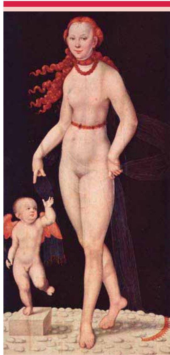
Figura 2. Lucas Cranach el Joven (1515-1586). Venus y Cupido . c. 1540. Óleo sobre madera. 196 x 89 cm. Pinacoteca Antigua de Múnich, Alemania.

además de mostrarla embarazada por ser la madre de toda la humanidad. Un siglo después los Cranach (el Viejo y el Joven) pintaron de manera muy discreta el vello del pubis tanto en sus Evas desnudas como en las Venus, de las que se da un ejemplo en la Figura 2 .