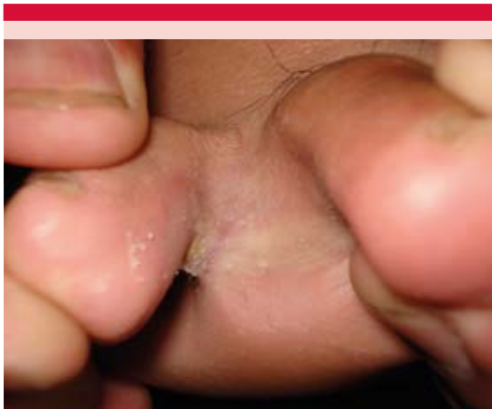
Figura 1. Eritrasma y tiña interdigital.

Turquía. 17 Otro estudio efectuado en México, de Morales-Trujillo, reporta incidencia de 32.8%. 1 La edad media de manifestación es de 43.6 años. 17 Afecta por lo general a adultos sanos; sin embargo, el riesgo aumenta en pacientes diabéticos, adultos mayores, personas con inmunodepresión y, con menos frecuencia, obesidad, hiperhidrosis y en personas que viven en climas tropicales. 7,18-21 Otros autores consideran que el