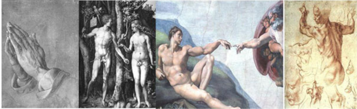
Fig. 2. De izquierda a derecha: "Estudio de manos orando" y "Adán y Eva" (Alberto Durero), "La creación del hombre" y "Estudio para la sibila libia" (Miguel Ángel Buonarrotti).

Estas imágenes estimularán la sensibilidad de los estudiantes y serán fuerzas motrices para buscar nuevas obras, para que se interesen por conocer los autores, la época en que hicieron esas obras, sus fuentes de inspiración e incluso asociarla con el grado de desarrollo de la Medicina en ese momento. Para la Morfofisiología, que integra estructuras con funciones, podría proponerse a los estudiantes que investiguen, mediante un trabajo independiente, cuáles huesos, músculos, fascias y articulaciones se ponen en juego en violoncelistas, violinistas y violistas para interpretar por ejemplo "Las cuatro estaciones" de Vivaldi. Para ello se emplearían vídeos de orquestas famosas extranjeras y cubanas ejecutando fragmentos de la obra musical. También cuáles músculos de la cara para ejecutar partituras con instrumentos antiguos como las flautas dulces que usan los músicos del grupo cubano "Ars Longa" y escoger alguna pieza musical interpretada por ese destacado grupo de música antigua.