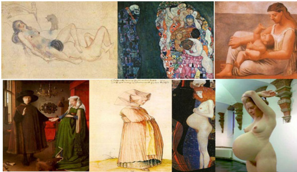
Fig. 3. En el recuadro superior, de izquierda a derecha: "Pareja haciendo el amor" (Pablo Picasso), "Vida y muerte" (Gustav Klimt), "Madre e hijo a orillas del mar" (Pablo Picasso). En el recuadro inferior: "Matrimonio Arnolfini" (Van Eyck), "Mujer vestida para la iglesia" (Alberto Durero), "Esperanza" (Gustav Klimt), "Embarazada" (Ron Mueck).

apreciar la belleza de la mujer que espera un hijo en obras como "Esperanza" de Gustav Klimt y en una estatua de mujer embarazada, obra escultórica monumental de Ron Mueck, artista australiano, cuyas esculturas parecen vivas por los materiales que emplea, las expresiones que les imprime y el trabajo del detalle (Fig. 3).