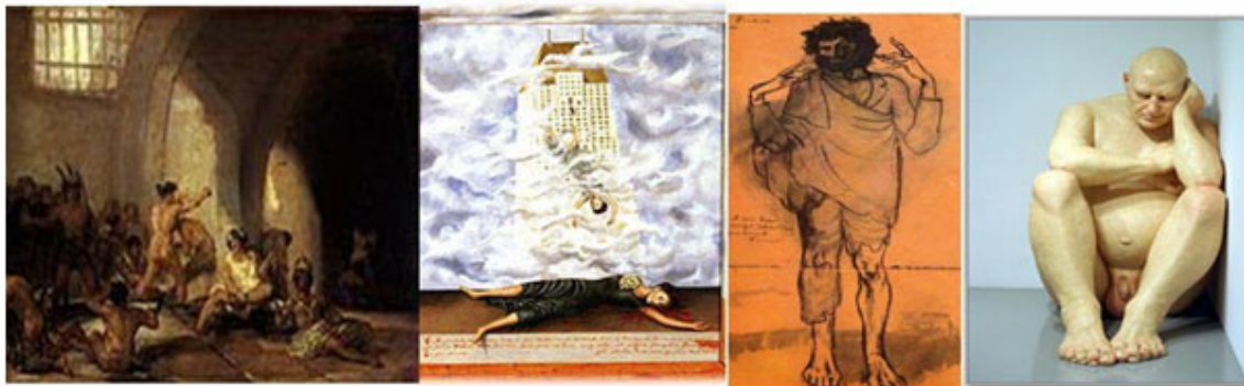
Fig. 4. De izquierda a derecha: "Casa de locos" (Francisco de Goya), "Suicidio de Dorothy Hale" (Frida Kahlo), "El loco" (Pablo Picasso), "Soledad" (Ron Mueck).