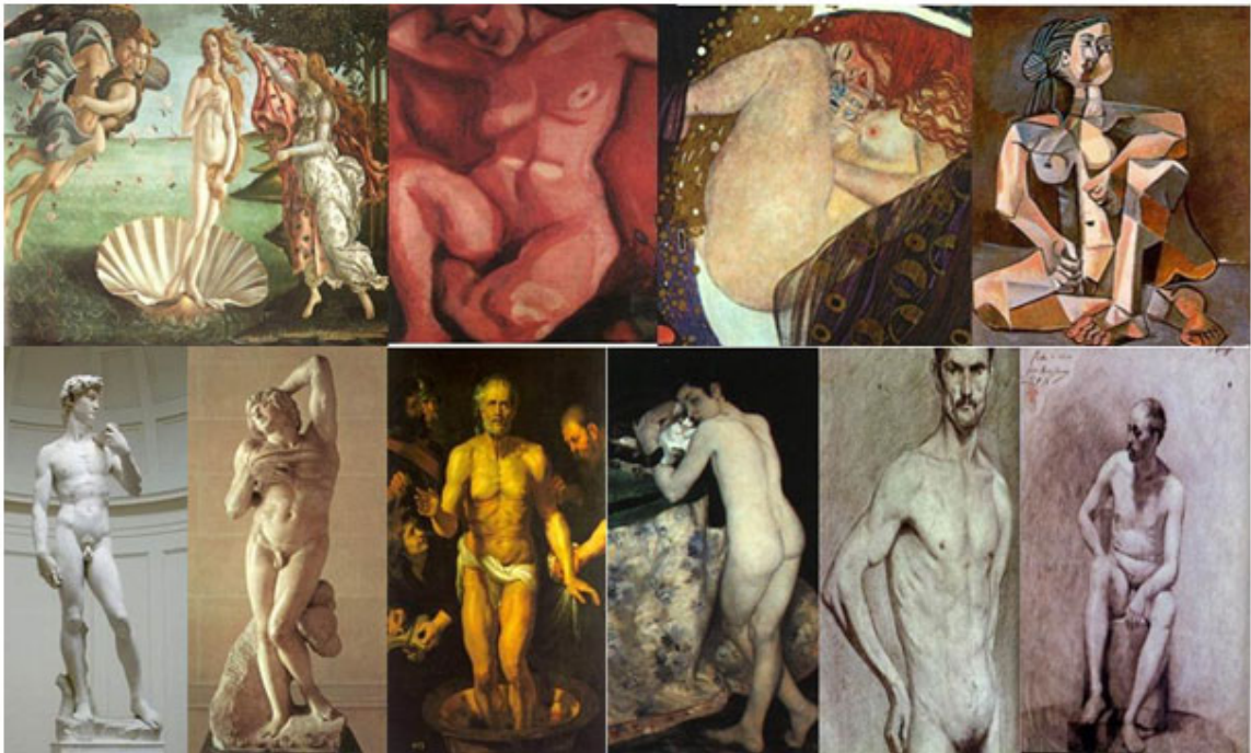
Fig. 1. En el recuadro superior, de izquierda a derecha: "Nacimiento de Venus" (Sandro Boticelli), "Desnudo en rojo sentada" (Marc Chagall), "Danae" (Gustav Klimt) y "Mujer" (Pablo Picasso 1953). En el recuadro inferior: "David" y "Esclavo moribundo" (Miguel Ángel Buonarotti), "La muerte de Séneca" (Pedro Pablo Rubens), "Muchacho con gato" (Pierre A Renoir) y "Estudio académico de un modelo 1 y 2" (Pablo Picasso).

Renacimiento y de los contemporáneos, mostrando, por ejemplo, la sarcopenia del envejecimiento, lo que servirá a los estudiantes para contrastar épocas y tendencias artísticas y características del cuerpo humano según edades. Proponemos dos obras escultóricas de Miguel Ángel, el "David" y "El esclavo moribundo" donde se aprecian los detalles musculares y óseos en una posición de reposo "atento" y en otra de dolor y sufrimiento. En "La muerte de Séneca" de Rubens, las estructuras relevantes son los muslos y piernas en la posición semiacucillado, en contraposición con la languidez y escaso desarrollo muscular del "Muchacho con gato" de Renoir donde se transformaron los motivos y formas de representar el cuerpo en la plástica. El Picasso en la época juvenil muestra cuerpos que no son bellos pero sí reales, uno de ellos en franco proceso de envejecimiento, útil para destacar las transformaciones que provoca la edad y la falta de ejercicio físico (Fig. 1).