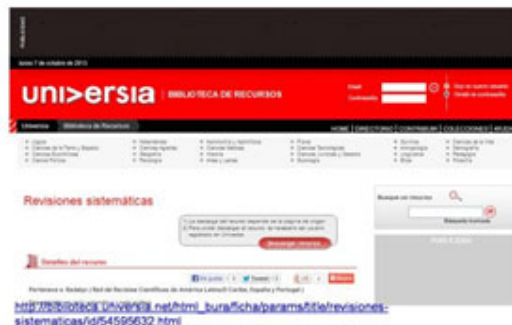
Fig. 8. Universia.

Universia . Biblioteca de Recursos, que en su sistema de búsqueda permite el acceso y descarga de Revisiones Sistemáticas previo el registro del usuario (Fig. 8).