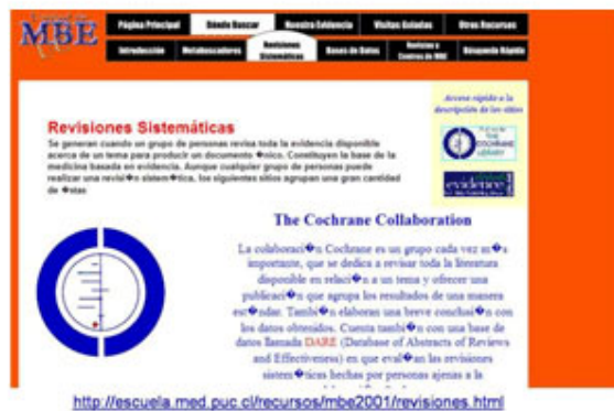
Fig. 3. Medicina basada en evidencia.

Medicina Basada en Evidencia. Espacio de la Escuela de Medicina de Chile dedicado a las revisiones sistemáticas y a la Colaboración Cochrane, enlaza varios sitios con resultados en este tema (Fig. 3).