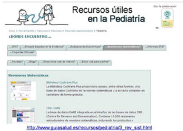
Fig. 4. Recursos útiles en la Pediatría. Dónde encuentro...

http://www.guiasalud.es/recursos/pediatria/3_rev_sist.html