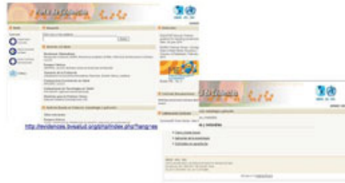
Fig. 6. Portal de evidencias BVS.

http://evidences.bvsalud.org/php/index.php?lang=es