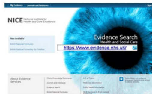
Fig. 5. NICE.

NICE . Portal de evidencia británico del Instituto Nacional para la excelencia en el cuidado en Salud, ofrece un buscador desarrollado por el NICE que proporciona acceso a gran variedad de información, entre las que se encuentra artículos científicos originales, herramientas de implementación prácticas, guías de práctica clínica, revisiones sistemáticas o documentos sobre políticas sanitarias (Fig. 5).