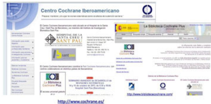
Fig. 1. Cochrane.

Colaboración Cochrane. Biblioteca Cochrane. La Biblioteca Cochrane Plus promueve el trabajo de la Colaboración Cochrane y de otros organismos que reúnen información fiable para guiar las decisiones en la atención sanitaria. Proporciona acceso, entre otras fuentes, a la base de datos Cochrane de revisiones sistemáticas y a su texto completo en castellano de forma gratuita (Fig. 1).