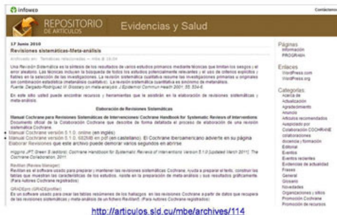
Fig. 2. BVS- Cuba. Repositorio de artículos. Evidencias y Salud.

http://articulos.sld.cu/mbe/archives/114