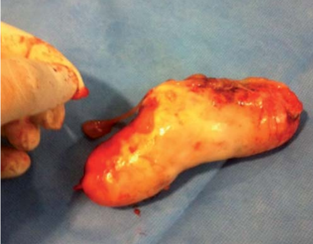
Figura 3. Apéndice resecado.