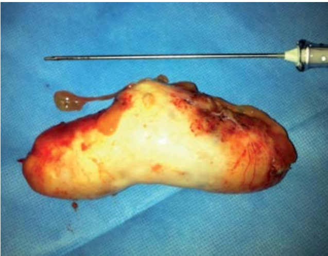
Figura 4. Apéndice resecado.

La neoplasia mucinosa de bajo grado de malignidad sin diferencias significativas con el adenoma mucinoso, desde el punto de vista citológico, presenta invasión de la pared apendicular y puede diseminarse en forma de implantes peritoneales (no metástasis). La posibilidad de recurrencia local es mayor ante la presencia de epitelio neoplásico en la mucina extraapendicular, asociándose también a un mayor riesgo de desarrollar enfermedad peritoneal difusa y menor supervivencia.