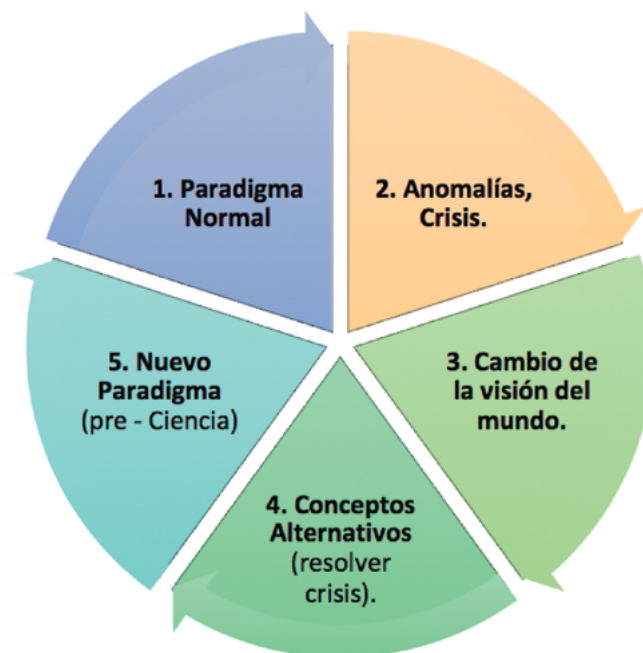
Figura 2. Estructura general de las revoluciones científicas.