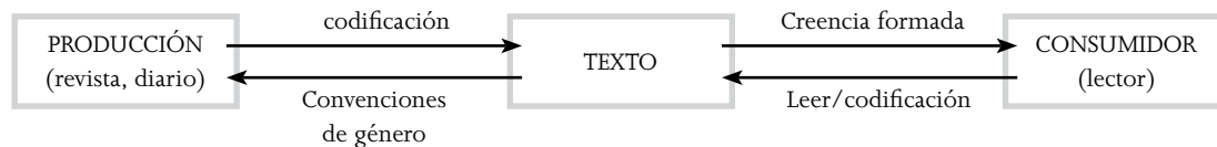
Figura 3. Prácticas discursivas 1 .

2.- Las practicas Discursivas : Hay dos dimensiones: la primera referida al proceso discursivo de una institución (organización), y la segunda está orientada al proceso discursivo del texto (producción/texto y consumo). Es decir, como dice Rojo 26 , “da cuenta de la relación que existe entre el texto y su contexto”. Por ejemplo, en las practicas discursivas relacionadas con documentos legales se debe focalizar en cómo se crean (que reglas se utilizan y el uso de lenguaje que se asigna en las instituciones/gobiernos) y en las formas (como ellos son distribuidos y leídos). Fairclough 5 dice que estas prácticas se relacionan con la producción, distribución y consumo de un texto. Por lo tanto, incluyen la producción paso a paso sobre como las personas producen e interpretan los textos para hacer visibles las prácticas discursivas utilizadas. En este nivel de análisis hay también un análisis lingüístico, llamado intertextualidad . Este se centraliza en los márgenes del texto y las prácticas discursivas. Es decir, hay que buscar en el texto los trazos de esas prácticas discursivas. Su análisis es interpretativo.