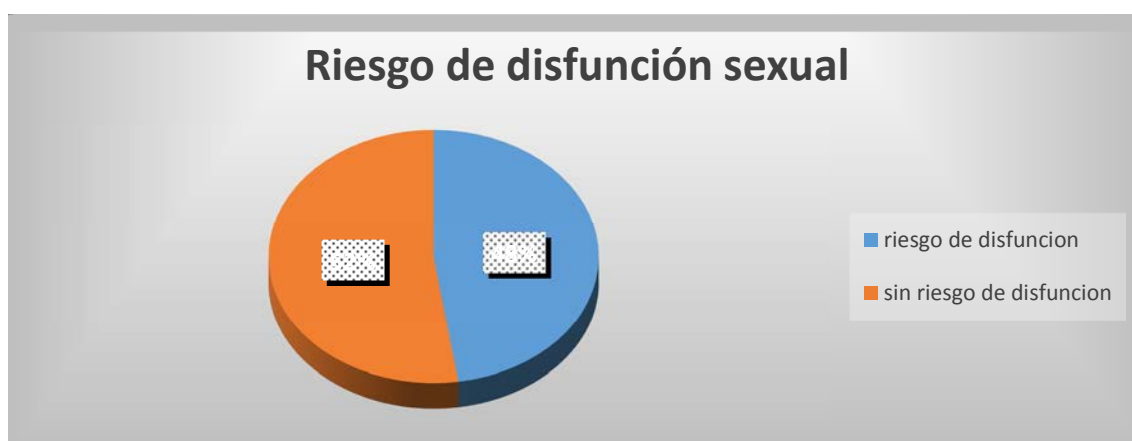
Grafico 3. Frecuencia relativa de estudiantes en riesgo de desarrollar disfunción sexual.

El riesgo de presentar disfunción sexual, considerando el valor de corte que establece el instrumento, estimado para puntuaciones medias del Índice General de Disfunción menores de 26, se describe en el grafico 3.