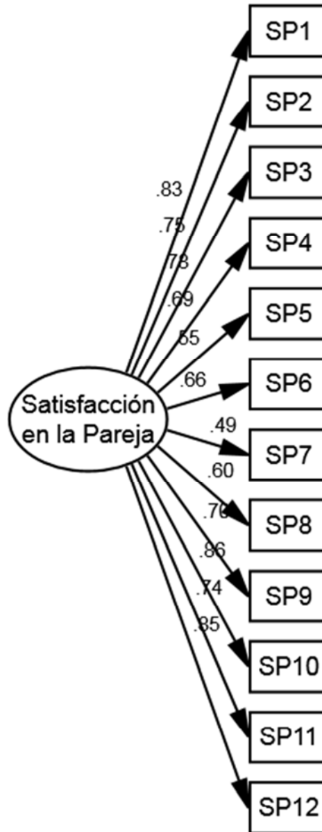
Figura 1: Modelo Base (MB) de la ESP-10

reactivos 5 y 7 no se ajustan al modelo unidimensional hipotetizado en la escala. Esta nueva versión de la escala (M1) fue examinada mediante un nuevo análisis de factores confirmatorios arrojando un buen ajuste, \chi^2 = 73.254 (30) p < .000 , RMSEA = .05, GFI = .97, TLI = .98, CFI = .99, NFI = .98, IFI = .99, PCFI = .66, AIC = 123.254.