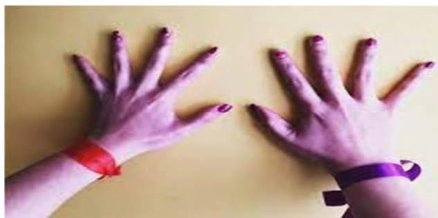
Pulseras de Ana y Mía. Disponible en la web: https://www.google.com.mx/search?q=pulseras+que+utilizan+ana+y+mia&source=lnms&tbm=isch&sa=X&ved=0ahUKEwjlobC169_iAhVRCKwKHYg1BR8Q_AUIECgB&biw=1366&bih=625

Lago, Carrera, Bermudez y Seijas (2012), documentaron el modo en que tales páginas crearon una serie de códigos e identificación para sistematizar e identificar a sus usuarios; han fabricado, por ejemplo, su propio lenguaje, tales como colocar el nombre de Ana y Mía para referirse a anorexia nerviosa (AN) y bulimia nerviosa (BN), respectivamente; también se utiliza una serie de signos de identificación los cuales son las pulseras con colores rojo y morado. El primero es el identificador de personas con anorexia y el segundo, con bulimia, las cuales se colocan en la mano izquierda, que confeccionan como símbolo reivindicativo de su “estilo de vida”.